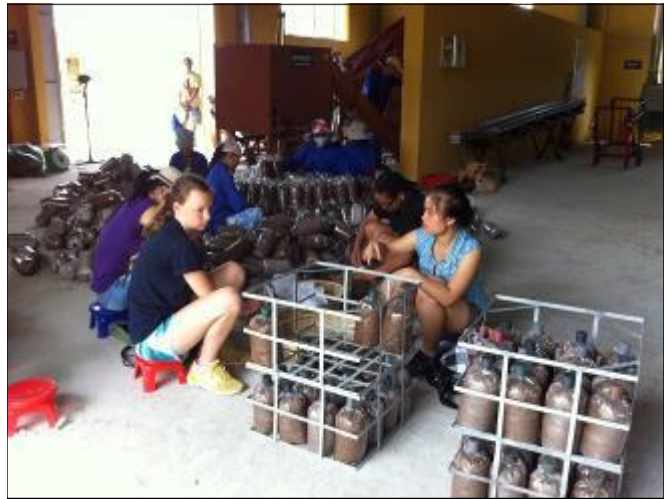
Sinh viên Đại học Michigan, Hoa Kỳ cùng tham gia sản xuất bịch nấm với