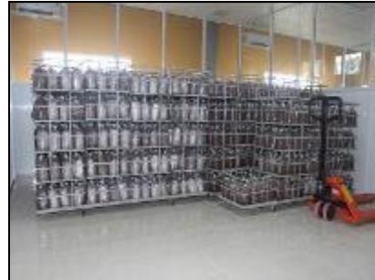
Phòng làm nguội với bộ lọc HEPA

cưa, máy trộn và đóng bịch với băng chuyền, hai nồi hơi cung cấp 300 kg hơi nước trong một giờ cho bốn lò hấp dùng để tiệt trùng bịch nấm. Tại đây còn có khu vực làm nguội với bộ lọc HEPA và phòng cấy nấm tiệt trùng.