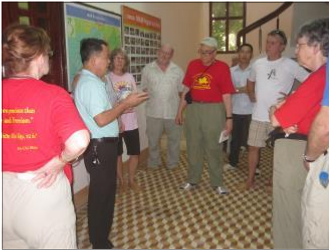
Đoàn Cựu chiến binh vì Hòa bình đến thăm Trung tâm Năm và tìm hiểu về hoạt động hỗ trợ của chương trình.