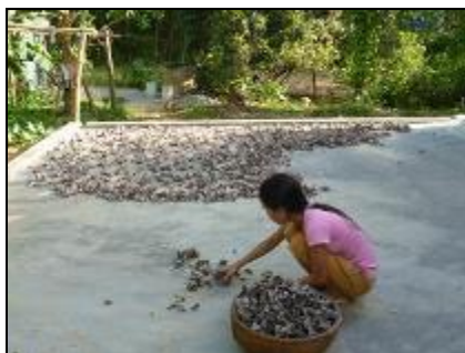
Nấm mộc nhĩ được phơi khô

Sứ mệnh của Nấm mua lại tất cả các loại nấm do hộ gia đình trồng. Với chứng chỉ VietGAP vừa được cấp, chương trình có thể bán nấm Linh chi cho các công ty dược phẩm để sản