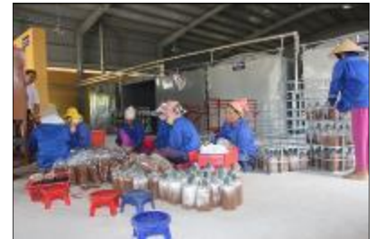
Máy đóng bịch và lò hấp

"Cơ sở vật chất và thiết bị mới cho phép Sứ mệnh của Nấm cung cấp bịch giống nấm kịp thời khi vụ mua đến, tạo điều kiện thuận lợi cho hộ gia đình nuôi trồng và thu hoạch sản lượng mong muốn," tiến sĩ Ái cho biết.