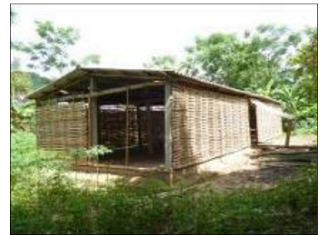
Nhà trồng cộng đồng ở Đakrông